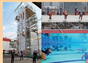
表紙 第41回全国消防救助技術大会

第60回全国消防技術者会議の開催 ..... 21 7月の主な通知 ..... 21 広報テーマ(9月分・10月分) ..... 21